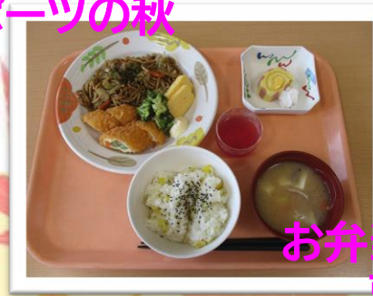
お弁当風プレート 栗ご飯